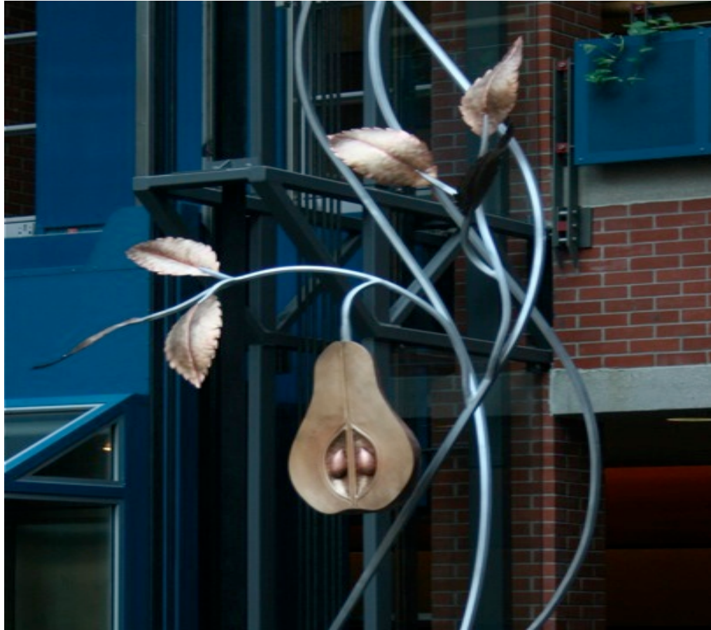
Mary Catherine Newcomb, Twisty Pear Tree , 2010. Atrium, Region of Waterloo Health Building